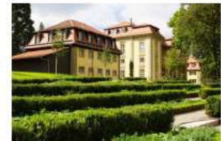
Hofgarten mit Orangerie Das grüne Idyll der Fürsten

Natürlich können Sie auch jederzeit abkürzen oder unterbrechen. Spazieren Sie alleine oder mit anderen - und entdecken Sie Öhringen auf neue, spannende Art.