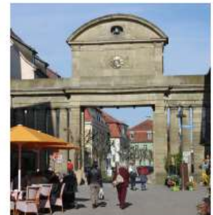
Oberes Tor Das „kleine Brandenburger Tor“ in Öhringen