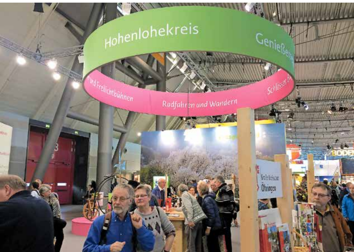
Die HOHENLOHER PERLEN sind bei der beliebtesten Touristik-Messe CMT aktiv dabei und werben für das Hohenloher Perlengebiet

Tourismus-Quartett mit Bretzfeld, Öhringen, Pfedelbach und Zweiflingen am Hohenloher Gemeinschaftsstand aktiv dabei