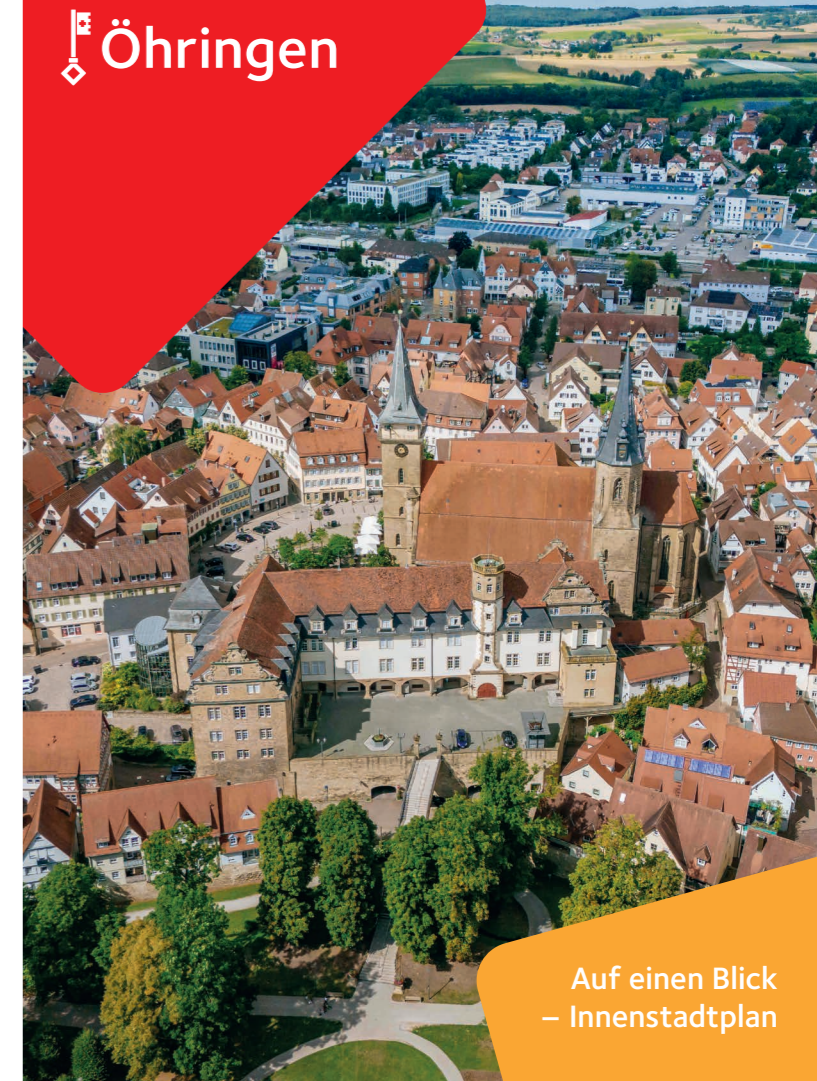
Auf einen Blick – Innenstadtplan